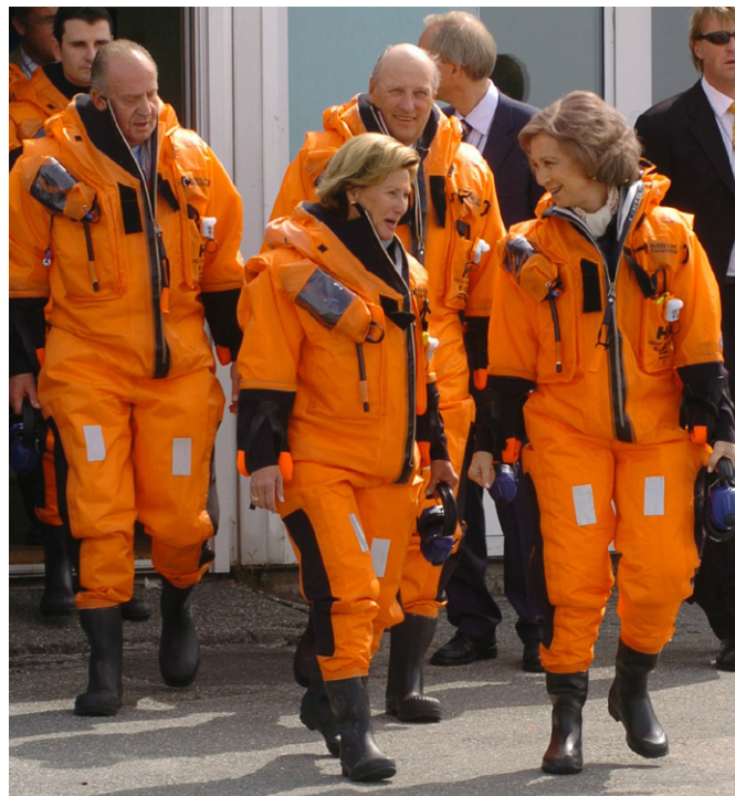
SS.MM. los Reyes de España, junto a los Reyes Harold y Sonja de Noruega, durante su visita a la plataforma petrolífera marina Troll A, cerca de la ciudad de Bergen, en su visita a Noruega realizada en junio de 2006.

6-2-1990 Canje de notas relativo a la participación de sus respectivos nacionales en las elecciones municipales. BOE, 27-6-91.