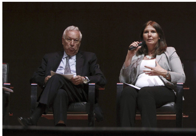
El ministro de Asuntos Exteriores y de Cooperación, José Manuel García-Margallo, junto a la viceministra de Exteriores de Noruega, Gry Larsen, durante sus intervenciones en el V Congreso Mundial contra la pena de muerte celebrado en Madrid, en junio de 2013.

Noruega pertenece a un gran número de organizaciones internacionales, entre ellas la EFTA, Consejo de Europa (en 2009 el noruego Thorbjorn Jagland fue elegido Secretario General), Consejo Nórdico, OCDE, ESA, CICR, IMF, ILO, varios bancos de desarrollo, Naciones Unidas y sus órganos subsidiarios y agencias especializadas, además de diversas agencias y programas europeos de investigación y tecnología (CERN, COST, EUREKA, etc.).